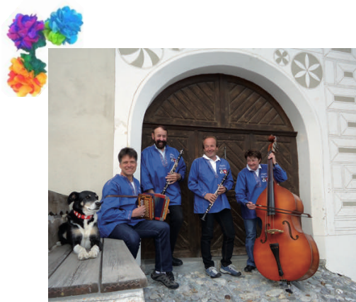
Chapella Alp Laret

Wir bitten um frühzeitige Anmeldung bis Montag, 28.2.2022 direkt bei Fam. Pampel, Réception Hotel Sport, 081 838 94 00 oder info@sporthotel.ch . Die Platzzahl ist begrenzt.