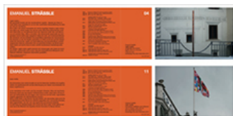
Emanuel Strässle voglio vedere , Skulpturale Intervention Kupfer, 350 cm x 10 cm à ~ Objekt 04 Chesa La Cuort, Kunstwege/Vias d'art Pontresina 2014