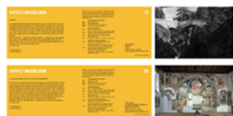
Mirko Baselgia Objekt 12, Punt'Ota , Wasser, Senda Punt'Ota, Texttafel, Cuntschet Kunstwege/Vias d'art Pontresina 2014