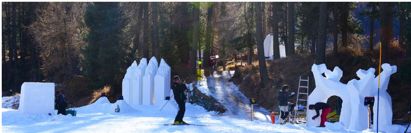
Kunstwege 2015