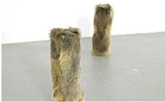
Mirko Baselgia "Guardians" 2009 Guardians (sirena alpina) marmotfur, metal, sensor, speaker, audiofile, à 11 cm, height 44 cm