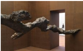
Mirko Baselgia "Endoderm", 2012-13 Bronze, 110cm x 880cm x 330cm, Scale 1:1