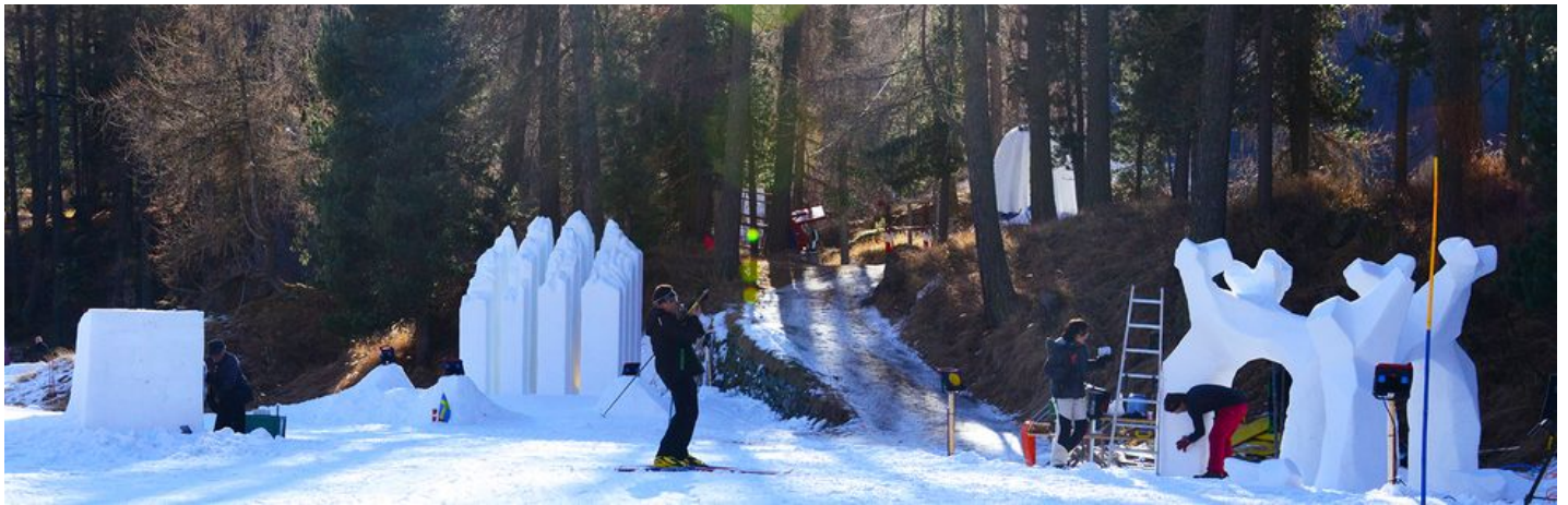
Kunstwege 2015 Foto Erika Saratz1