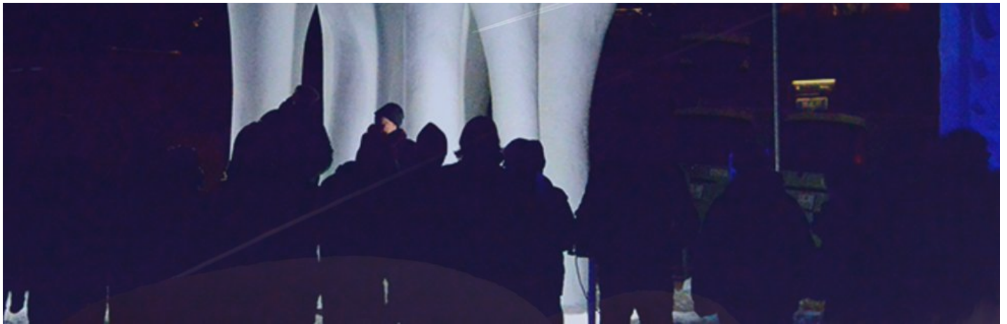
Kunstwege 201514