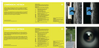
Christine Camenisch | Johannes Vetsch 'Südwand' , Installation, kleiner Baum, Digitalprint, Beleuchtung, 50 x 70 x 50 cm (B/H/T) Objekt 05 Zwischenraum, Laret, Kunstwege/Vias d'art Pontresina 2014