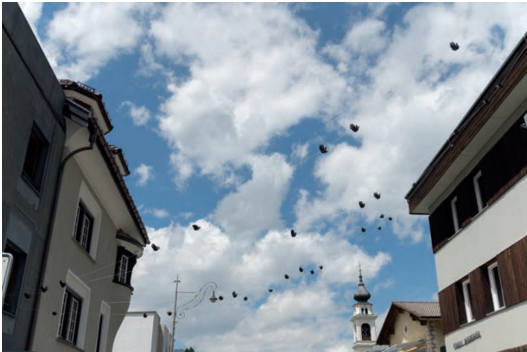
Pontresina

Zuckerbäckerei Gianottis Via Maistra Kunstwege/Vias d'art Pontresina 2017